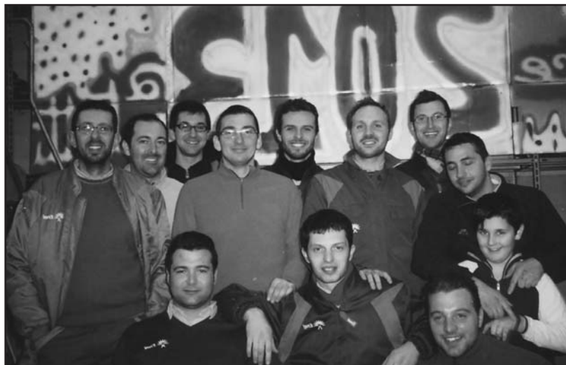
"I giovani" lavoratori dell'Enel.

Uno scambio di auguri per le feste natalizie e per un 2013 di lavoro, salute e serenità; da parte dei dipendenti Enel un augurio a tutta la popolazione.