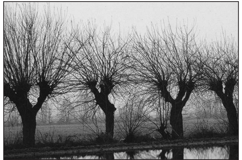
"Gelsi d'inverno" da MONTICHIARI 2000 - BAMS Edizioni, dicembre 1999.

Il libro è stato pubblicato sul sito "ilmiolibro.it" con l'appoggio dell'editore Feltrinelli.