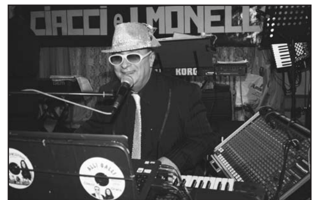
Lo showman Ciacci.

Verrà effettuata anche una estrazione, con tre premi, riservata esclusivamente a coloro che entro quella sera avranno rinnovato l'abbonamento. Buona fortuna e soprattutto buon divertimento.