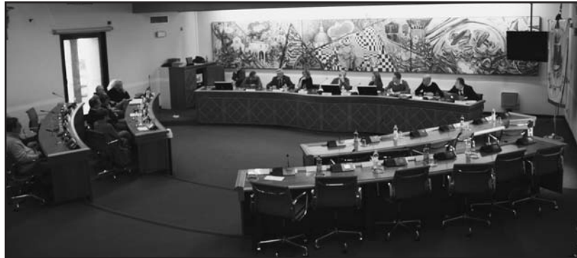
Il consiglio comunale "vuoto" del PGT.

Il nuovo strumento urbanistico infatti "doveva" essere la radiografia del paese, dal numero degli abitanti, ai servizi erogati e necessari per le esigenze dei cittadini, alle attività economiche, commerciali, agricole, alla viabilità complessiva a tutti quegli interventi per un nuovo PROGETTO PAESE , ideato dal compianto sindaco Scalvini negli anni Settanta. Quei riferi-