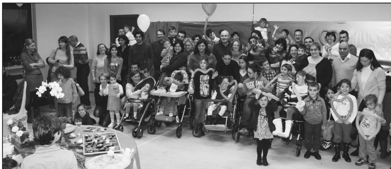
Foto di gruppo dei partecipanti alla festa.

Ancora una volta Montichiari, tramite questa Onlus, fa da baricentro zonale e portavoce di questo difficile, problematico e talvolta silenzioso mondo della disabilità infantile.